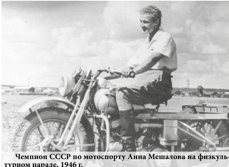
Чемпион СССР по мотоспорту Анна Мешалова на физкультурном параде, 1946 г.