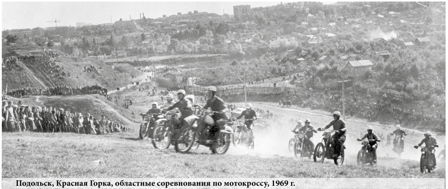
Подольск, Красная Горка, областные соревнования по мотокроссу, 1969 г.