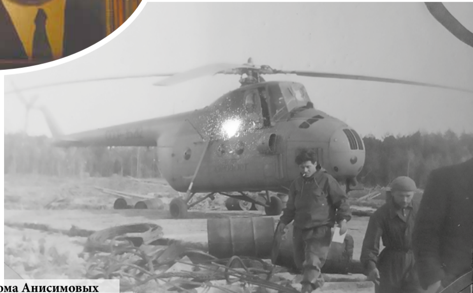
Из семейного альбома Анисимовых