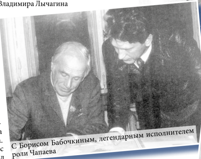
С Борисом Бабочкиным, легендарным исполнителем роли Чапаева