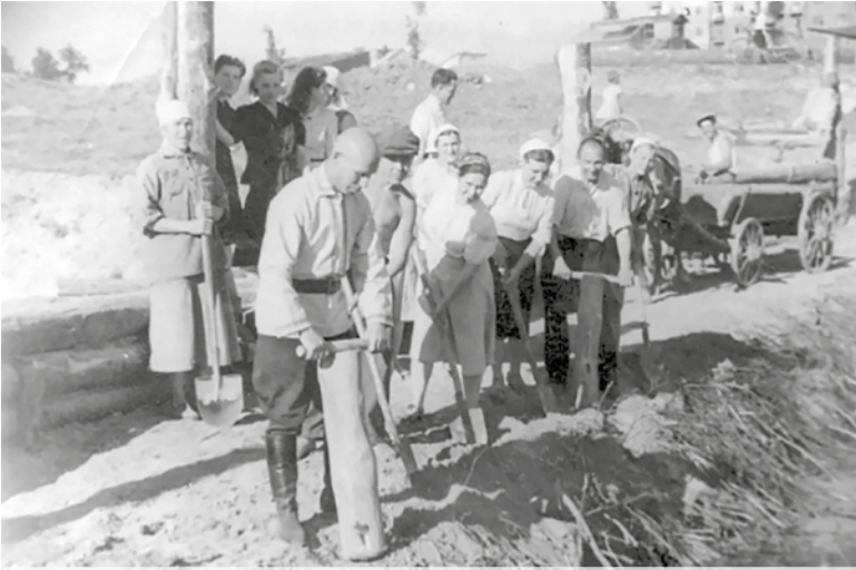
Строительство плотины на реке Петрице, 1947 г.