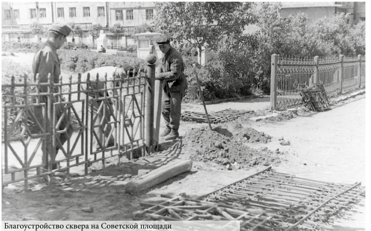
Благоустройство сквера на Советской площади

Расходы на здравоохранение увеличились в 2,5 раза. В октябре 1946 г. в городской больнице было открыто новое родильное отделение на 45 коек, а в начале 1947-го