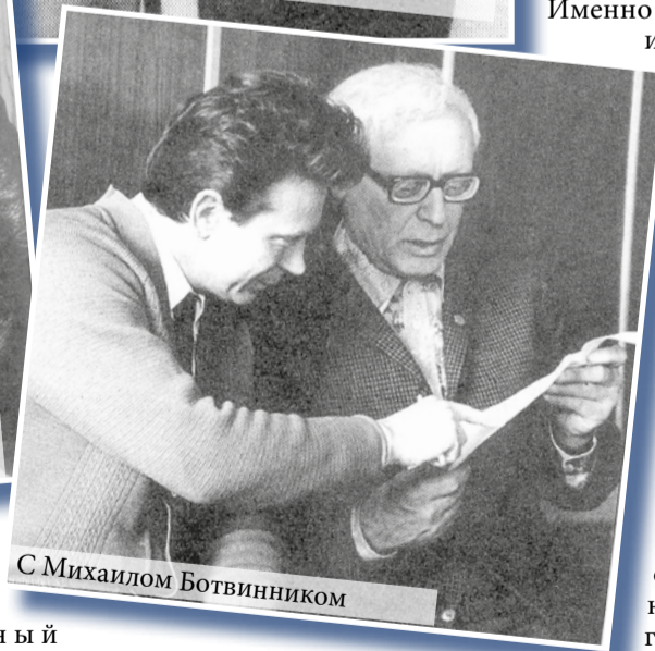
С Михаилом Ботвинником