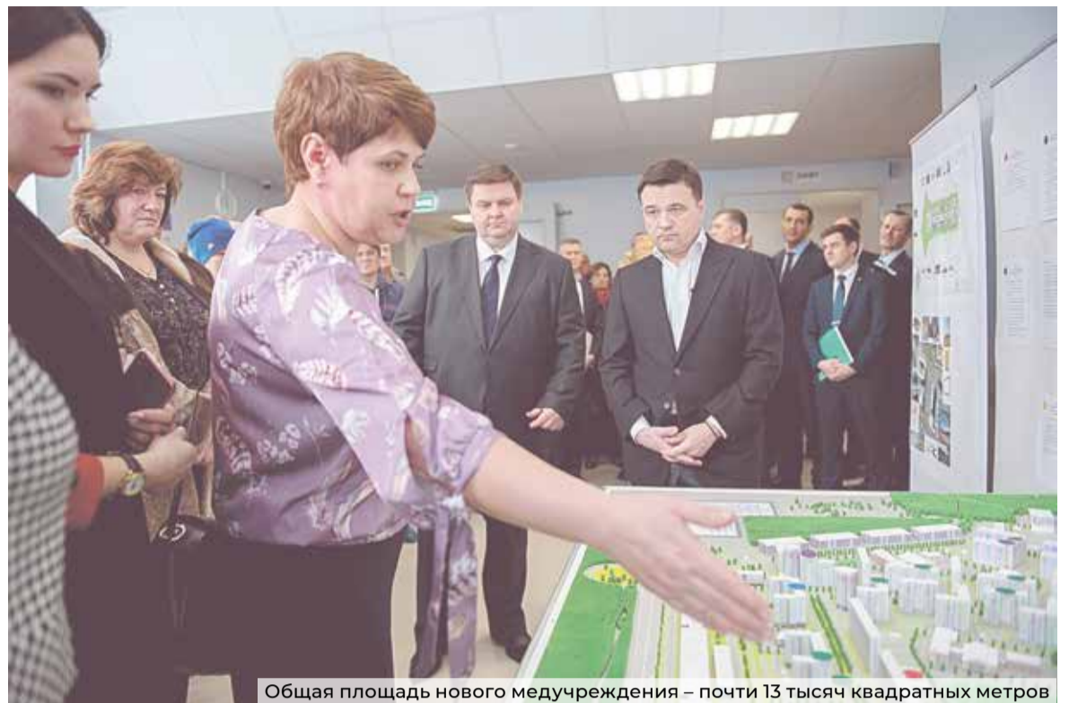
Общая площадь нового медучреждения – почти 13 тысяч квадратных метров

дания позволяет визуализировать мелкие объекты и анатомические структуры с детализацией и контрастным расширением. Кроме того, эти системы позволяют без плёнок и проявочной лаборатории выводить цифровые снимки на экран и затем передавать их на консультацию специалистам в МОНИКИ. И самое важное – большое количество кабинетов для самых востребованных врачей – терапевтов и педиатров. Кроме того, имеются кабинеты с отдельным входом для пациентов с неясной этиологией заболевания.