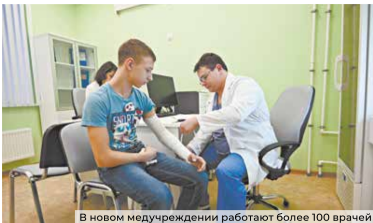
В новом медучреждении работают более 100 врачей

Учреждение здравоохранения оснащено эндоскопическим и флюорографическим оборудованием, ультразвуковыми аппаратами, специальными стоматологическими установками, а также современными рентгеновскими системами. За счёт использования цифровой системы на базе плоскостной детектора это оборудование снижает лучевую нагрузку на пациентов. Качество изображе-