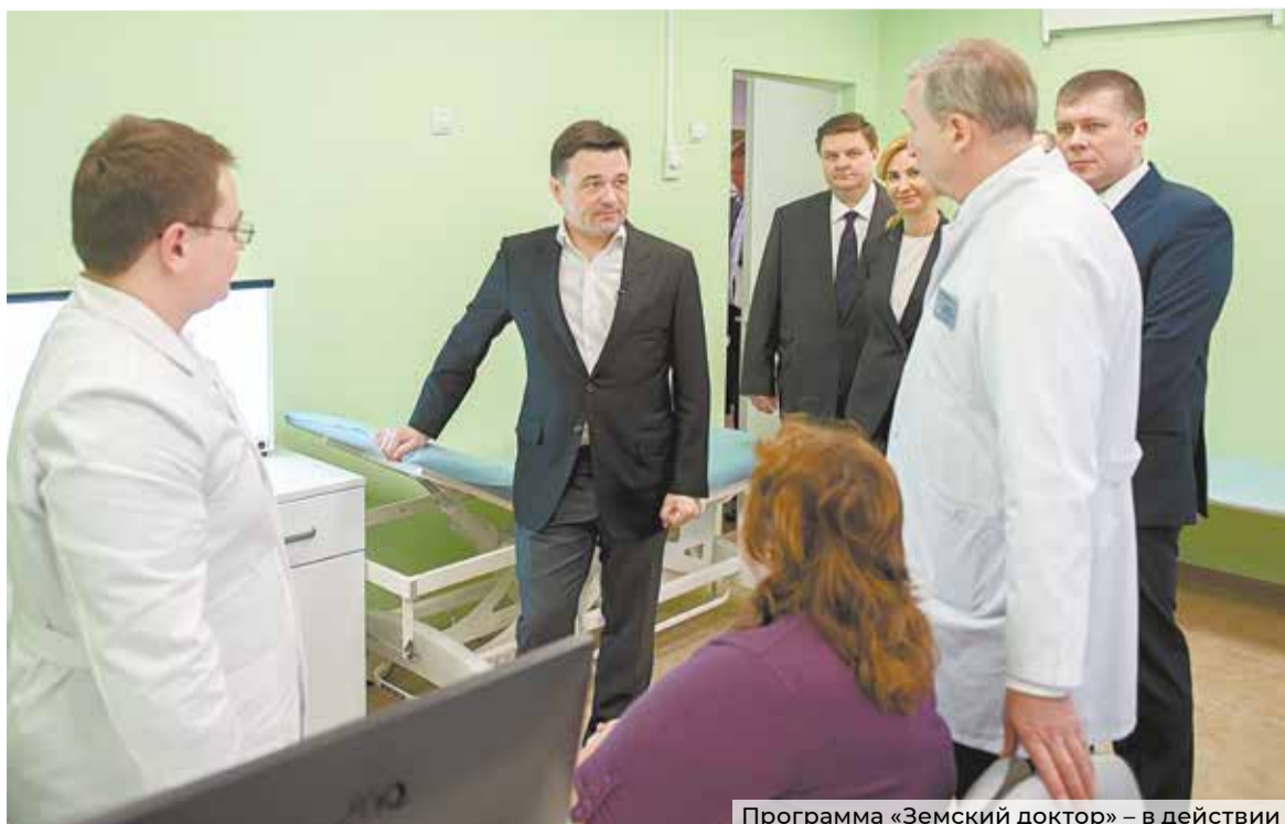
Программа «Земский доктор» – в действии

Подготовлено по материалам сайтов Губернатора и Правительства Московской области и пресс-службы администрации Городского округа Подольск