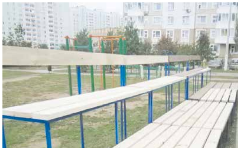
Текст и фото: Официальная страница ВКонтакте «Муп Дез-Г-Подольск»

Также в настоящее время специалисты управляющей компании МУП «ДЕЗ» ремонтируют кровлю многоквартирного дома №64 на улице Плещеевская и подъезды дома №47 на той же улице.