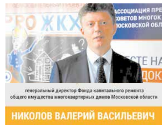
генеральный директор Фонда капитального ремонта общего имущества многоквартирных домов Московской области

Пресс-служба администрации Городского округа Подольск