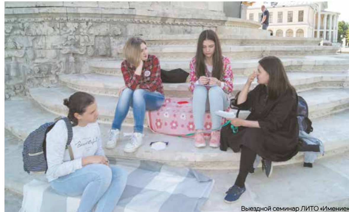
Вязевой семинар ЛИТО «Имение»