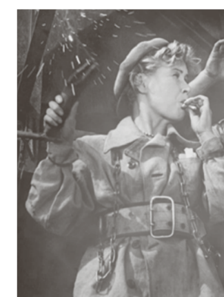
Кадр из фильма «Высота» 1957 год