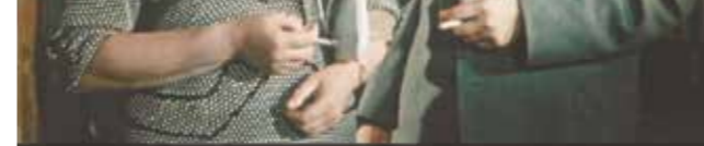
Кадр из фильма «За витриной универмага» 1955 год

– Ну и традиционный вопрос – каковы литературные планы на будущее? – Недавно закончил работу над двумя рассказами, послал их в один из журналов. Надеюсь в скором времени закончить работу над второй повестью, события в которой происходят в наше время. В этом году планирую издать свою новую сказку для самых юных читателей.