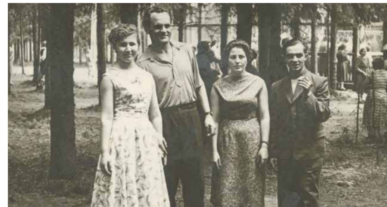
Молодёжь 50-х пришла на танцы

более, если она сама об этом спрашивала или уже подошла с ней в руке, прося всего лишь спичку, чтобы прикурить. И к ней сразу протягивались как правило, либо несколько горящих спичек, либо дорогая зажигалка, как мы помним по замечательному фильму «Москва слезам не верит» или курящую героиню Риммы Марковой в роли бескомпромиссного врача в комедии «Покровские ворота». Но это более современные фильмы о том времени. А если мы посмотрим кинофильмы тех лет, такие как «Максим Переле-