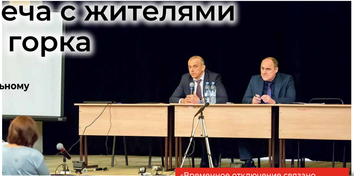
Подольск. После этого финансирование строительства объекта